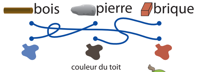
couleur du toit

Quel matériau reconnais-tu sous l'eau de la cascade de cet abreuvoir?