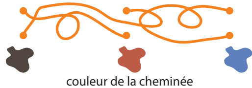
couleur de la cheminée