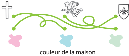
couleur de la maison

Que reconnais-tu de chaque côté du personnage sculpté à côté de la porte du n°2?