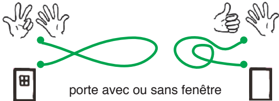
porte avec ou sans fenêtre

Combien de piliers en pierres soutiennent le toit de ce lavoir?