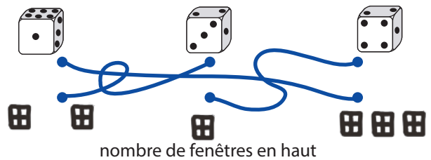
nombre de fenêtres en haut

Quel dé t'indique le nombre de têtes sculptées sur la façade de cette maison?