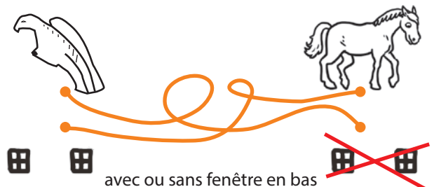
avec ou sans fenêtre en bas

Quel animal reconnais-tu sur la sculpture au-dessus de l'entrée de l'église?